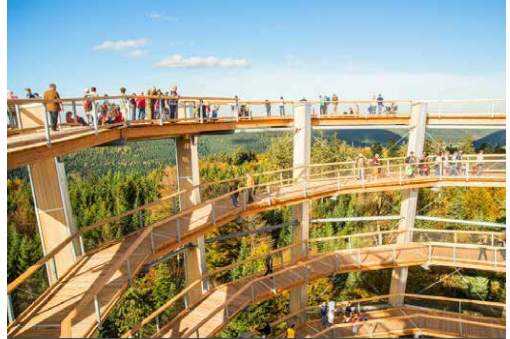
Bad Wildbad | Schwarzwald | Paket 5717

Verl.-Nacht/F 67,- | EZ 14,- | vor Sa./So./Fei. 12,-