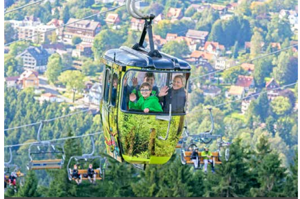
Wolfshagen | Harz | Paket 2034