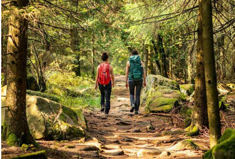
Pfinztal | Karlsruhe | Paket 5419