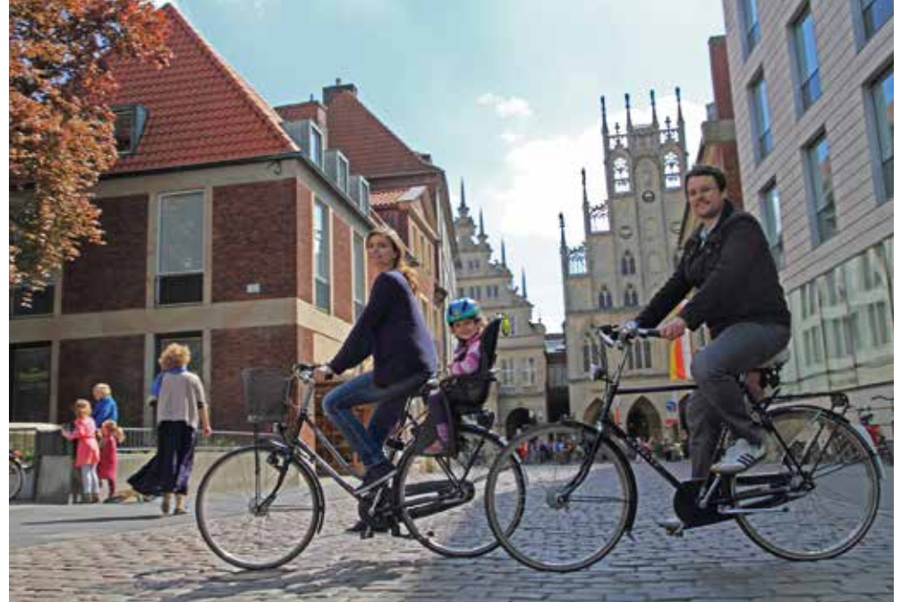
Münster | Paket 1582