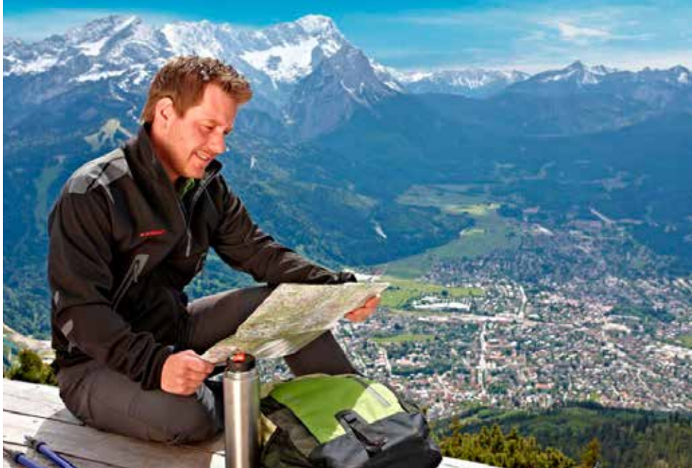
Garmisch-Partenkirchen | Oberbayern | Paket 2310