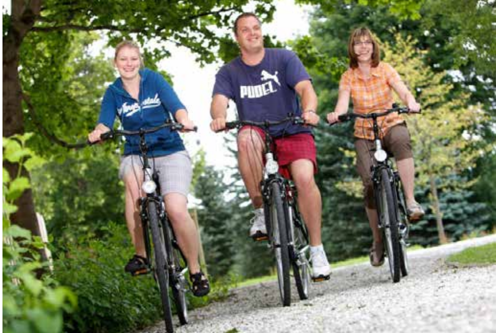
Friedrichroda | Thüringer Wald | Paket 2214