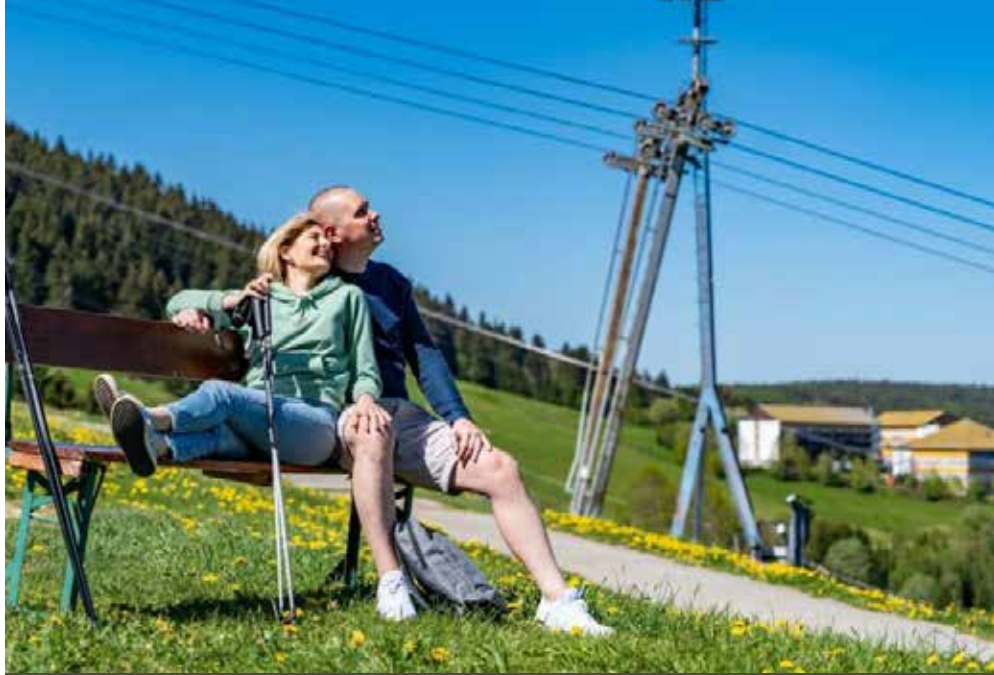
Oberwiesenthal | Erzgebirge | Paket 2711