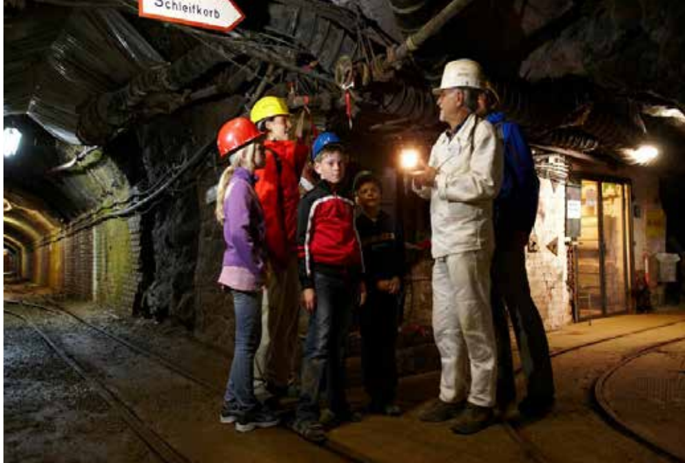
Wolfshagen | Harz | Paket 5643