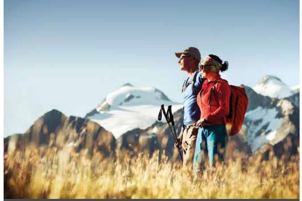
A – Fulpmes | Tirol | Paket 5264