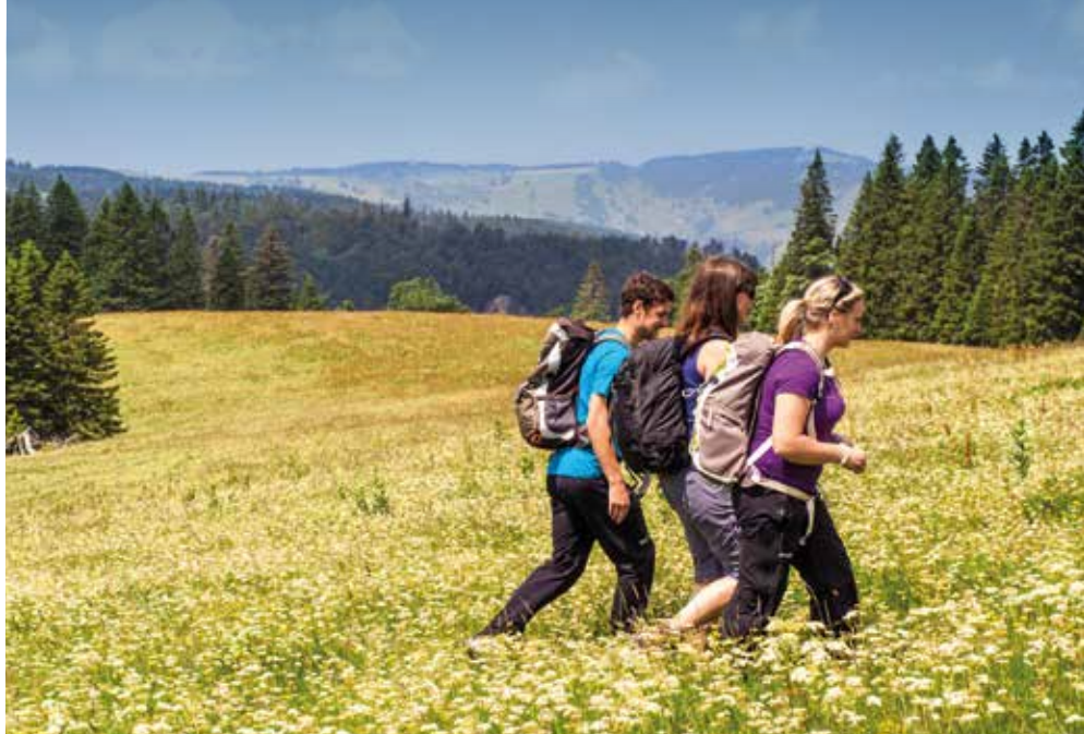
Freudenstadt | Schwarzwald | Paket 3062