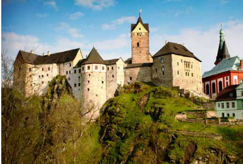
CZ - Marienbad | Böhmen | Paket 5734