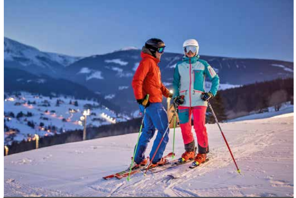
CZ - Pec pod Snezkou | Riesengebirge | Paket 0230