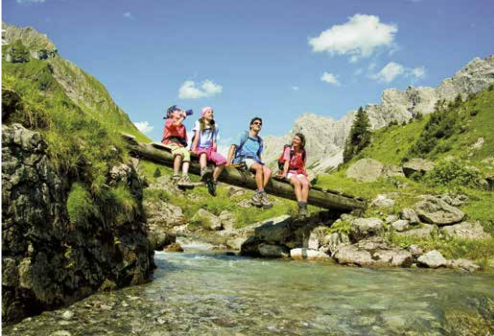
A – Bezaus | Bregenzerwald | Paket 0953