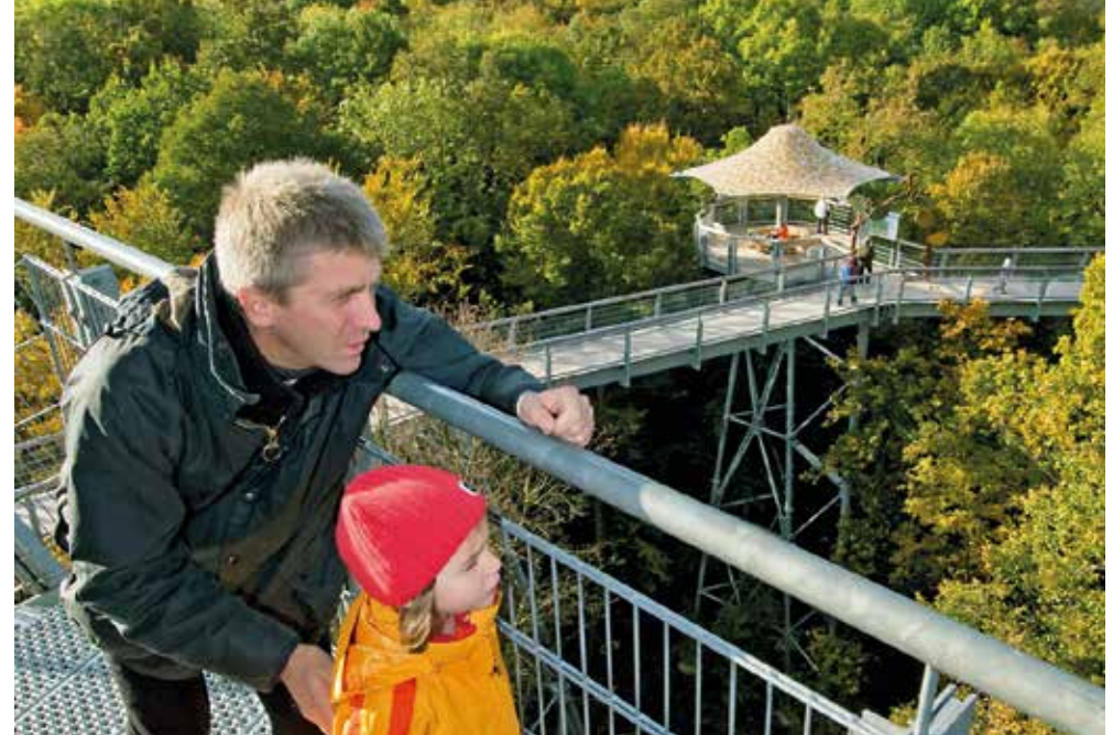
Eisenach | Thüringer Wald | Paket 2294