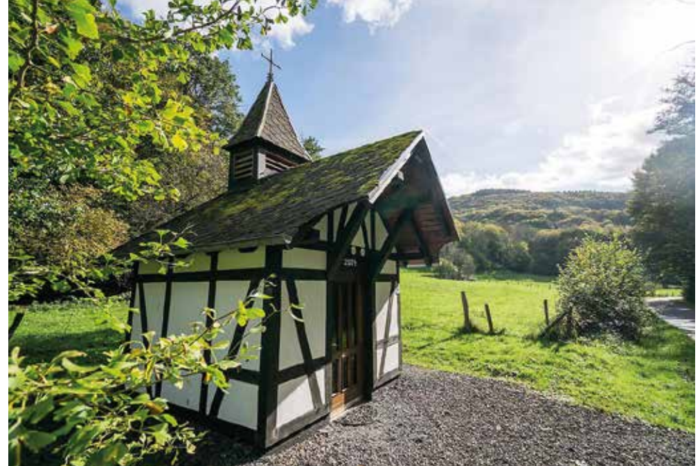
Waldbreitbach | Westerwald | Paket 5438

Verl.-Nacht/F 109,- | EZ 43,- | vor Sa./So. 14,-