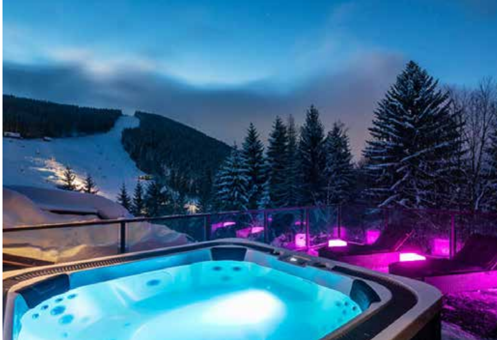
CZ - Harrachov | Riesengebirge | Paket 5693