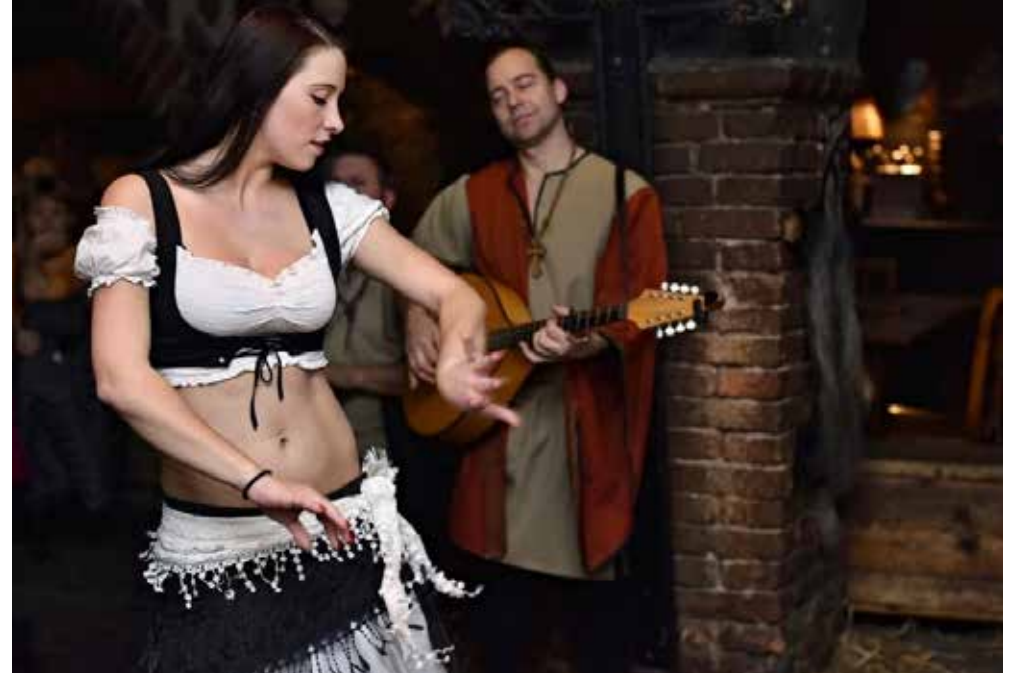
CZ - Detenice | Böhmen | Paket 5733