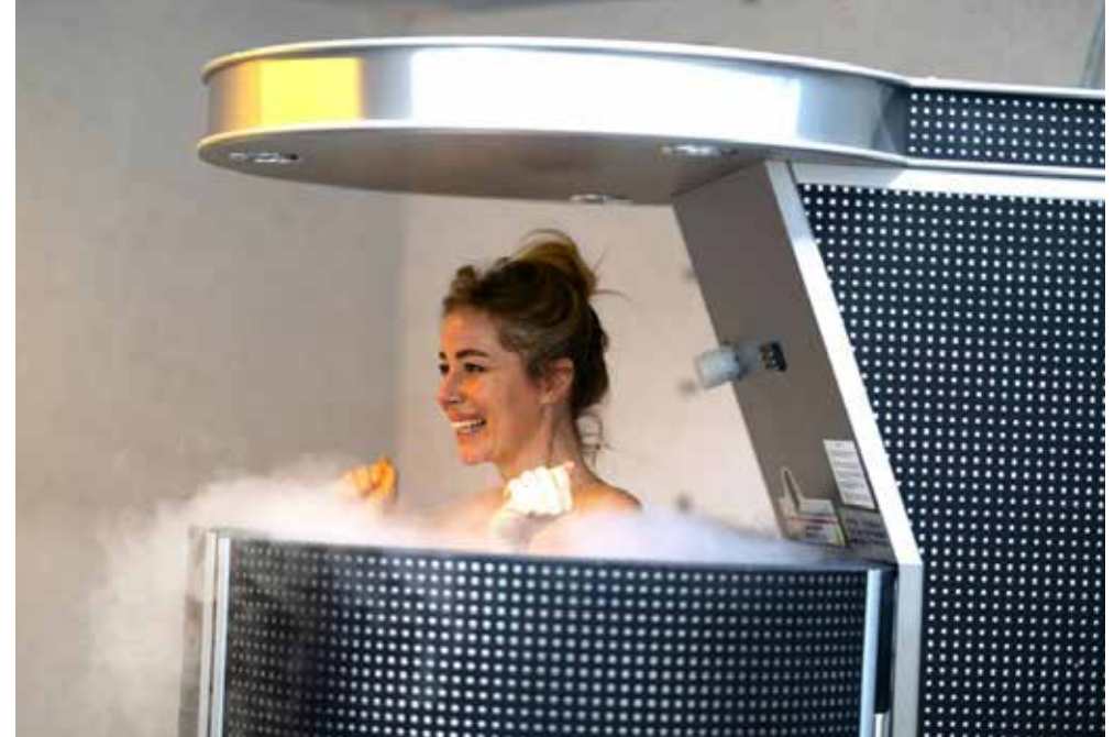
Badenweiler | Schwarzwald | Paket 4471

Wer den ganzen Tag an der frischen Luft stramm wandert oder die Umgebung mit dem Rad entdeckt, darf sich abends im Hotel verwöhnen lassen. Ein duftendes Bad, eine Massage, die verspannte Muskeln lockert, oder ein wohltuendes Saunaritual – begeben Sie sich in die Hände der Wellness-Profis und starten Sie erfrischt in den nächsten Tag.