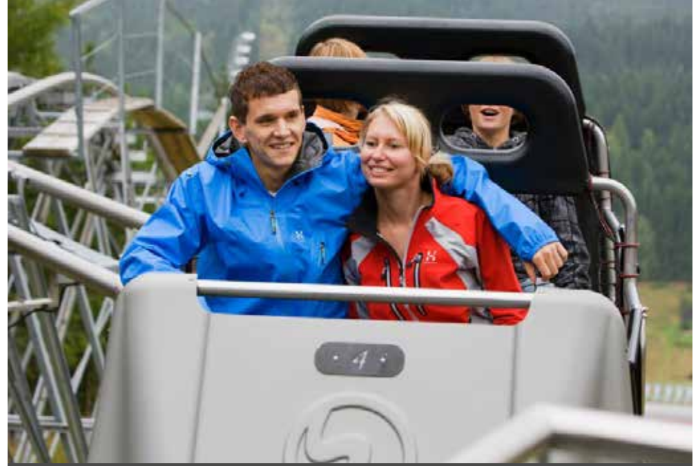
Schöneck | Vogtland | Paket 5762