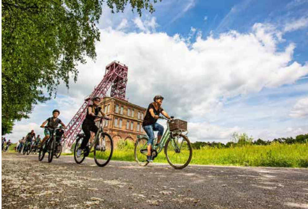
Oberhausen | Ruhrgebiet | Paket 5340