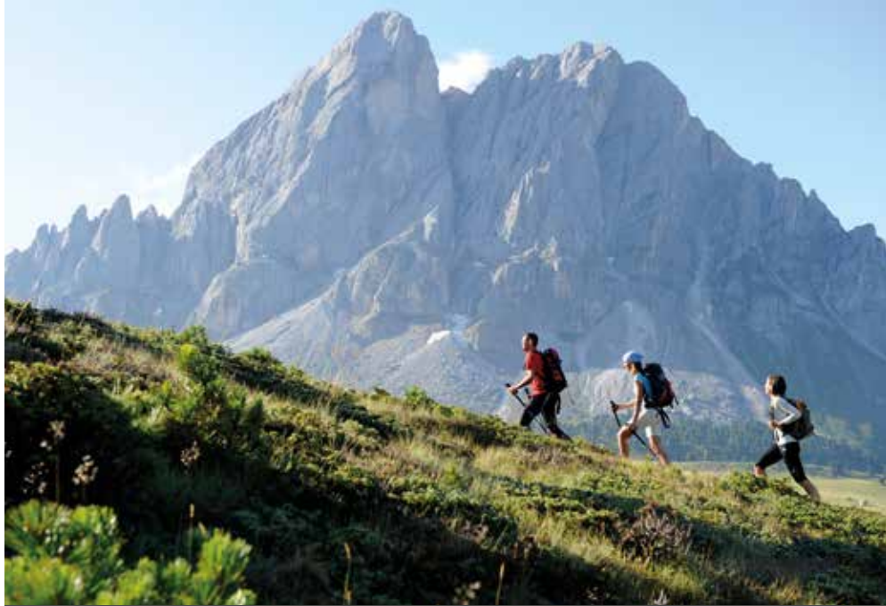
I – Sankt Vigil | Südtirol | Paket 3924