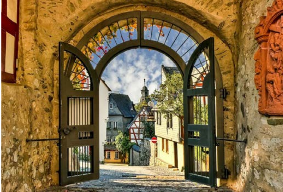
Limburg | Taunus | Paket 5472