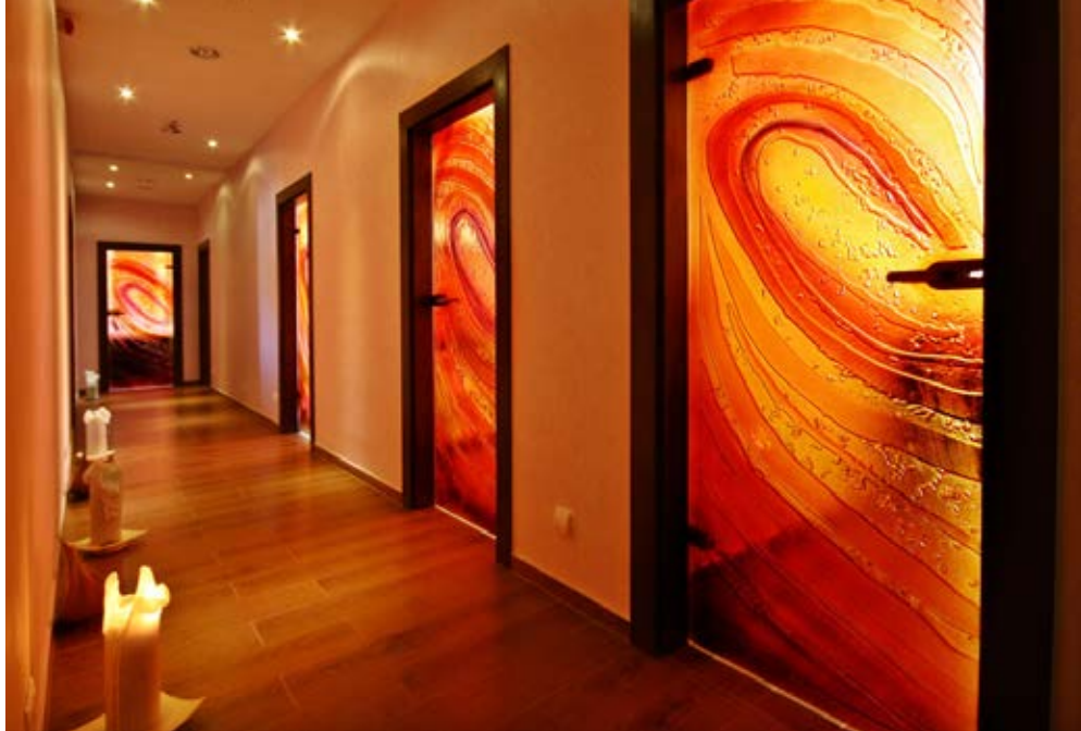
Kolberg | Polnische Ostsee | Paket 1158