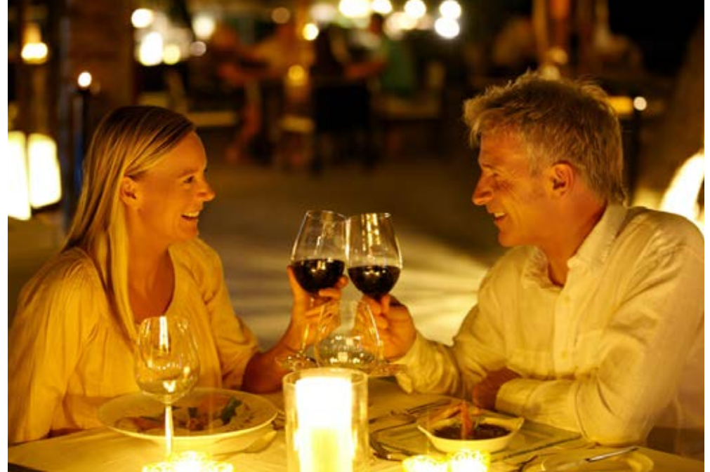
Baiersbronn | Schwarzwald | Paket 4041