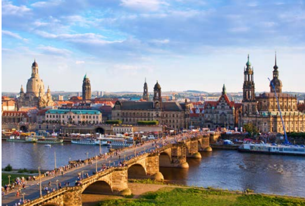
Dresden | Paket 5669