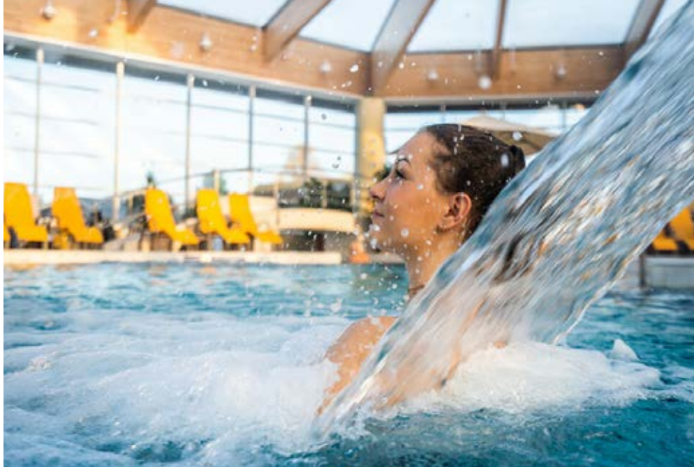
Bad Wilsnack | Brandenburg | Paket 0473