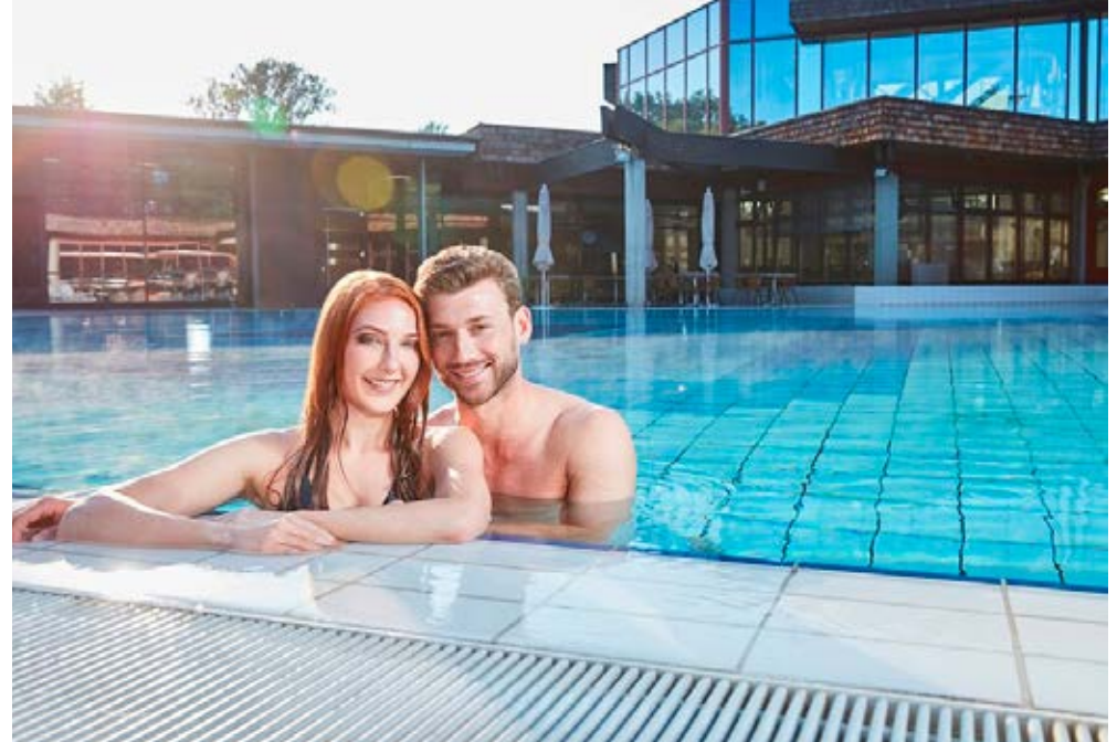
Augen | Schwarzwald | Paket 4633