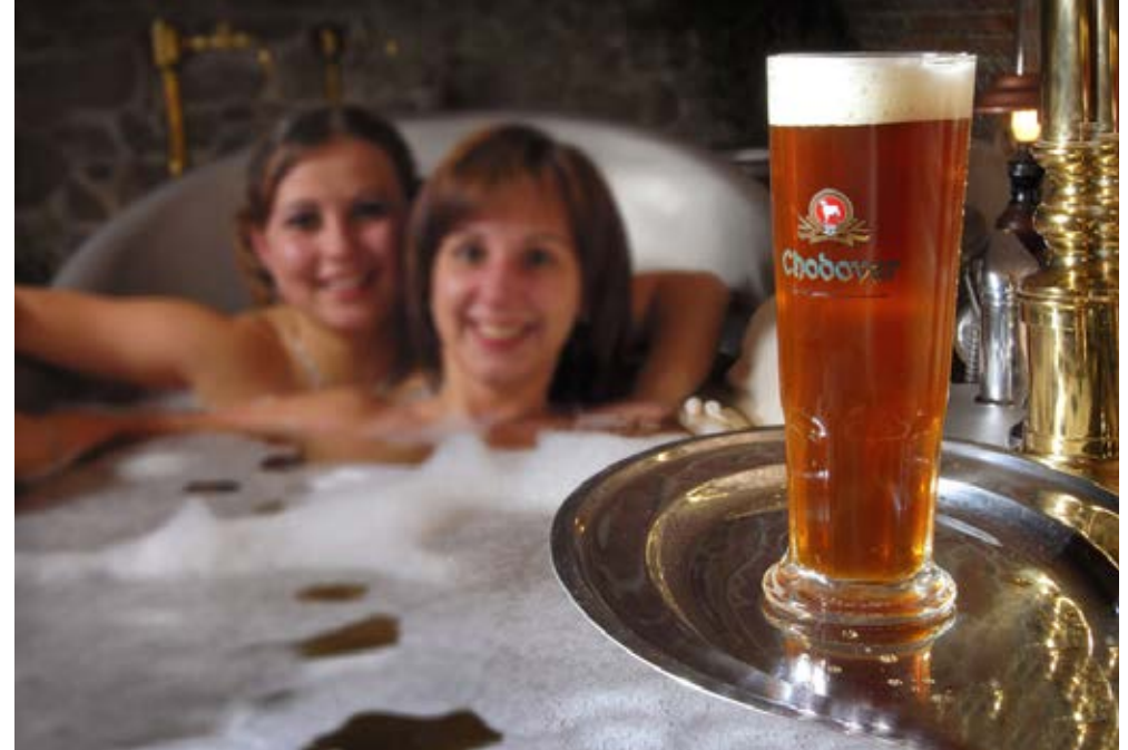
Chodová Planá | Böhmen | Paket 0314

Verl.-Nacht/F 72,- | EZ 30,- | Hauptsaison 14,-