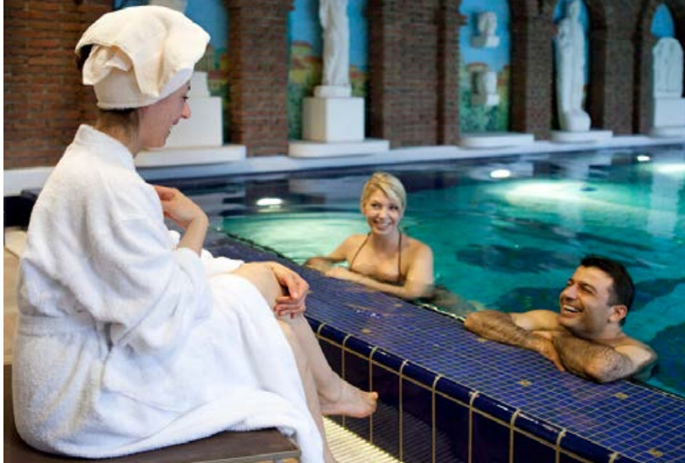
Badenweiler | Schwarzwald | Paket 2223