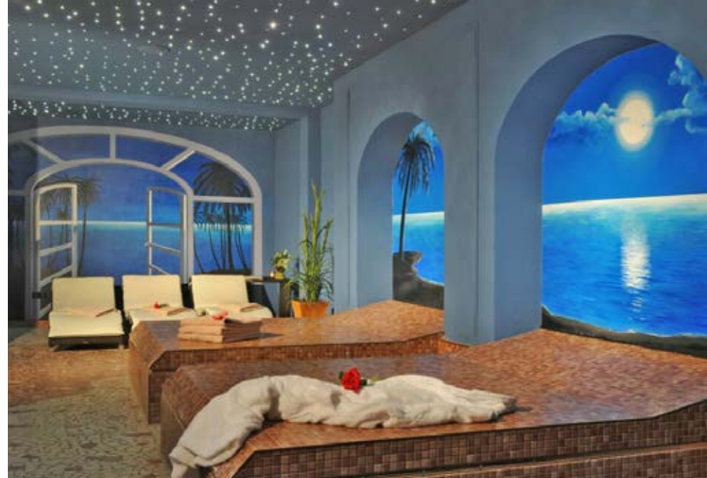
Bremen | Paket 2195