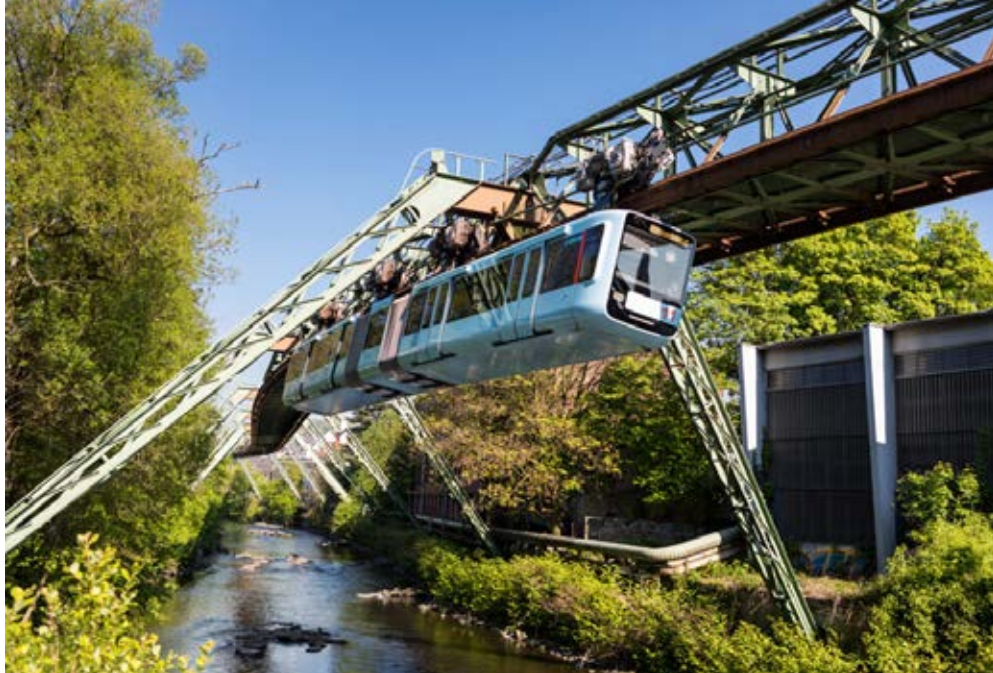
Wuppertal | Nordrhein-Westfalen | Paket 5386