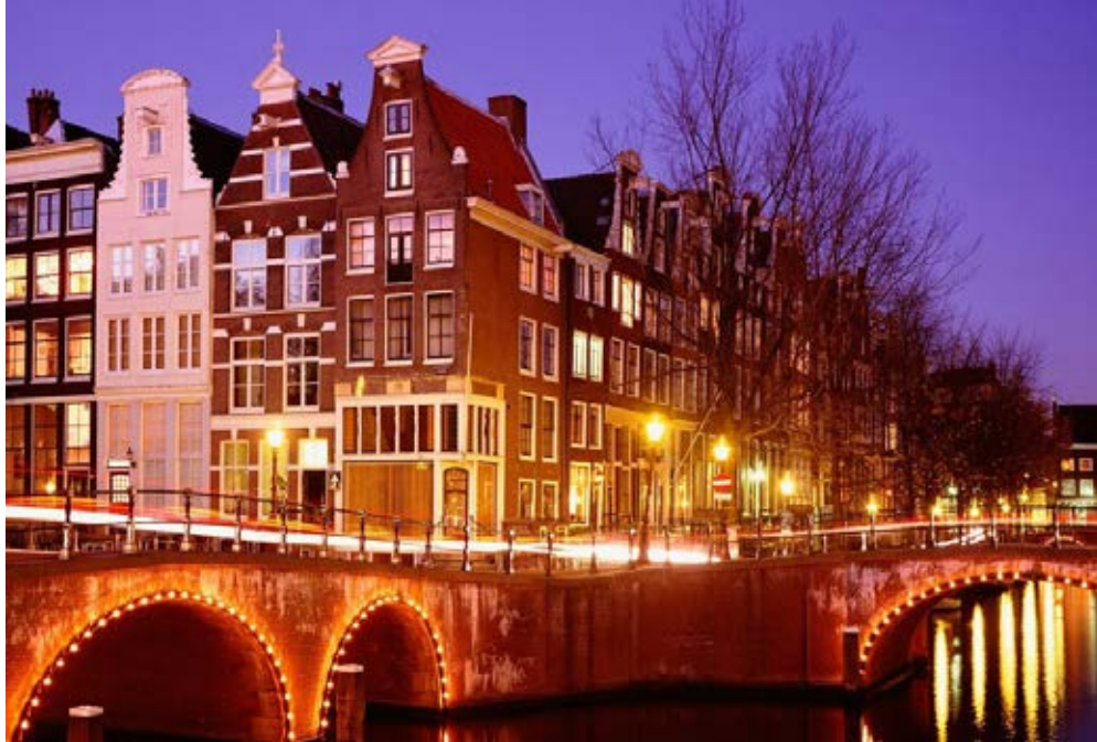
Amsterdam | Niederlande | Paket 5460