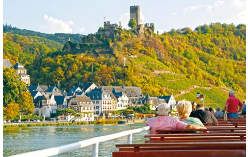
Ernst an der Mosel | Mosel | Paket 0191