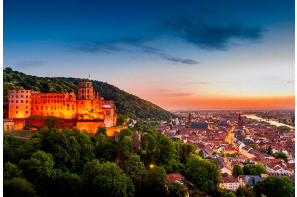
Heidelberg | Paket 5740