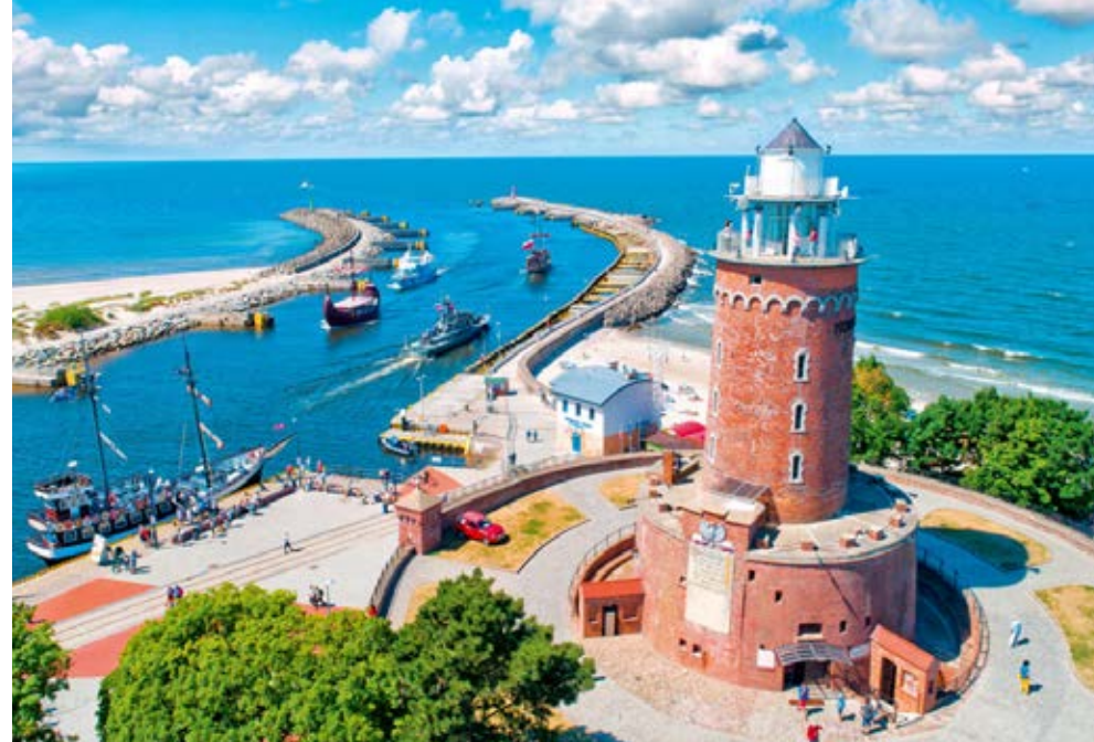
Kolberg | Polnische Ostsee | Paket 3858