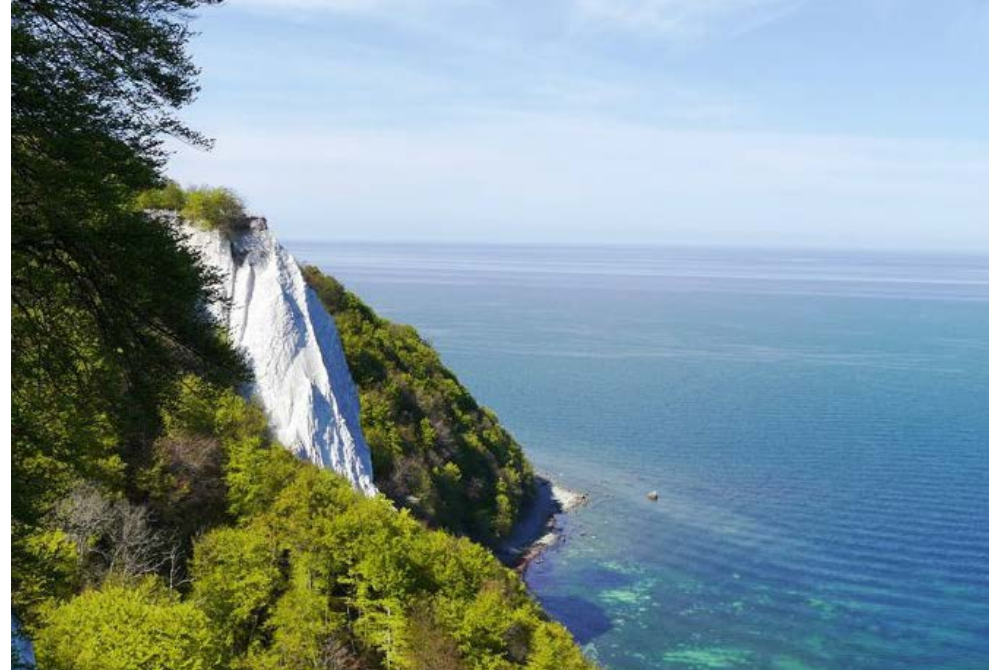
Breege | Ostsee | Paket 1051