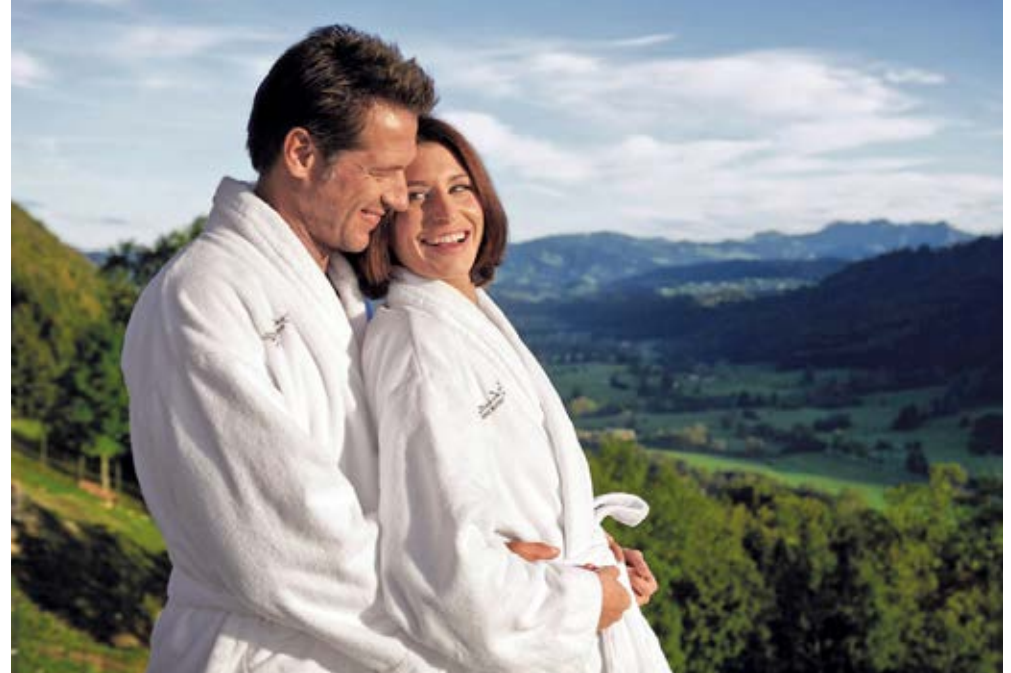
Ottobeuren | Allgäu | Paket 3967

Verl.-Nacht/F 87,- | EZ 20,- | Hauptsaison 8,- | Vor Sa./So./Fei. 10,-