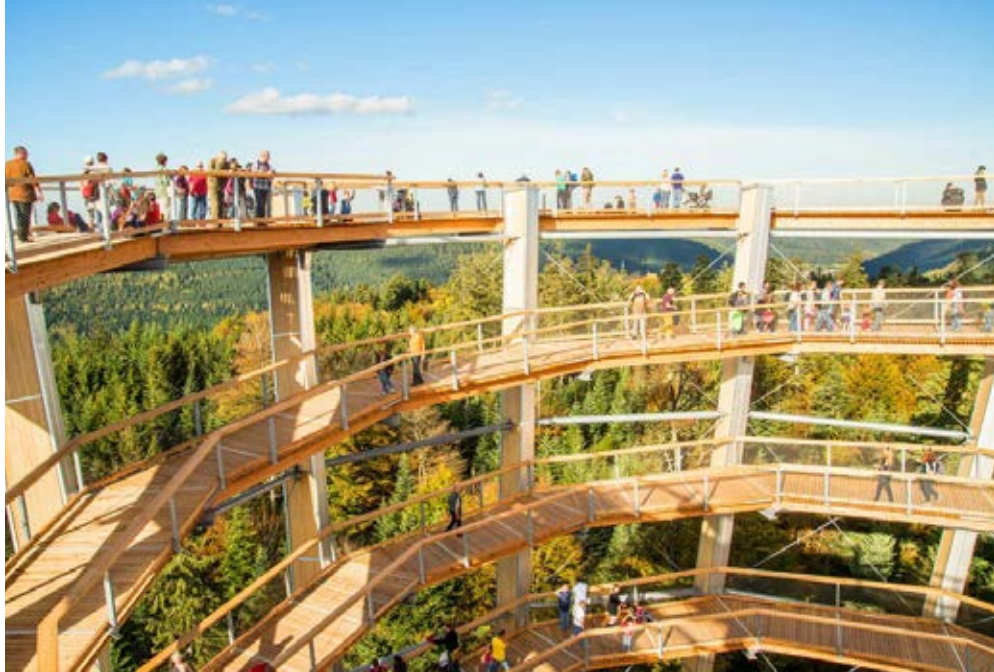
Bad Wildbad | Schwarzwald | Paket 4196