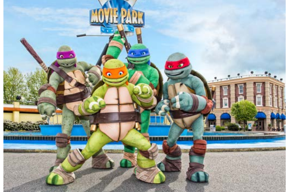
Oberhausen | Ruhrgebiet | Paket 4050