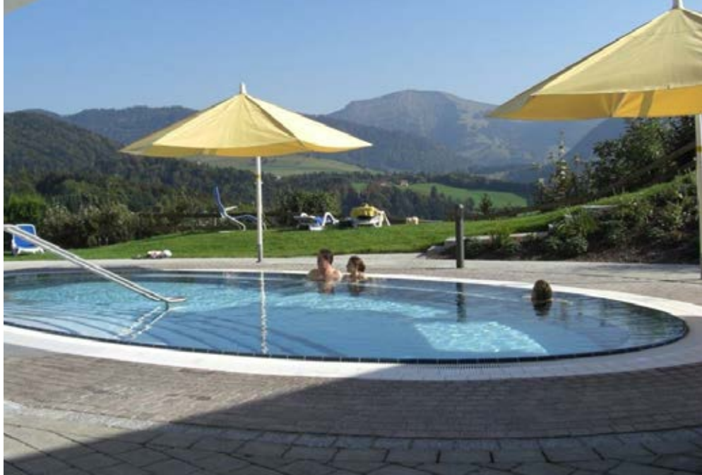
Oberstaufen | Allgäu | Paket 2176