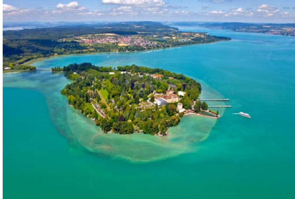
Konstanz | Bodensee | Paket 1017

Oder wollen Sie lange ausschlafen, später Mittagsschlaf halten und dann früh ins Bett? Unsere Producer haben alle Matratzen und Kissen selbst getestet. In unseren Partner-Hotels schlafen Sie wie ein Murmeltier. Stöbern Sie durch unsere Top-Empfehlungen und beliebtesten Angebote. Lassen Sie den Alltag zu Hause zurück, und finden Sie Ihre Mitte bei einer Auszeit mit Spar mit! Reisen.