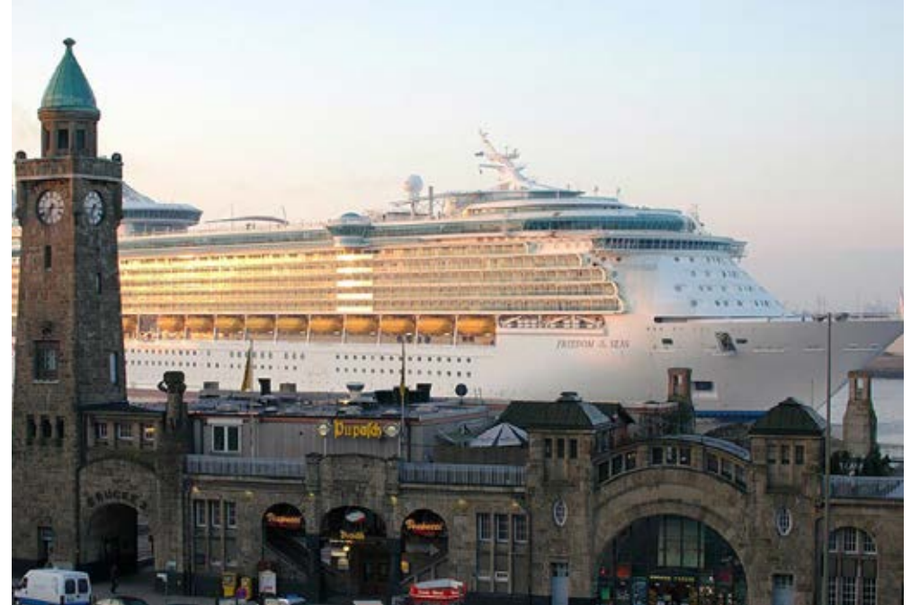
Hamburg | Paket 1753