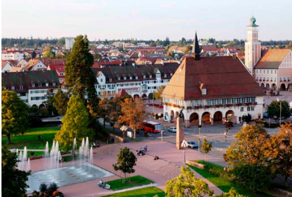
Freudenstadt | Schwarzwald | Paket 2264