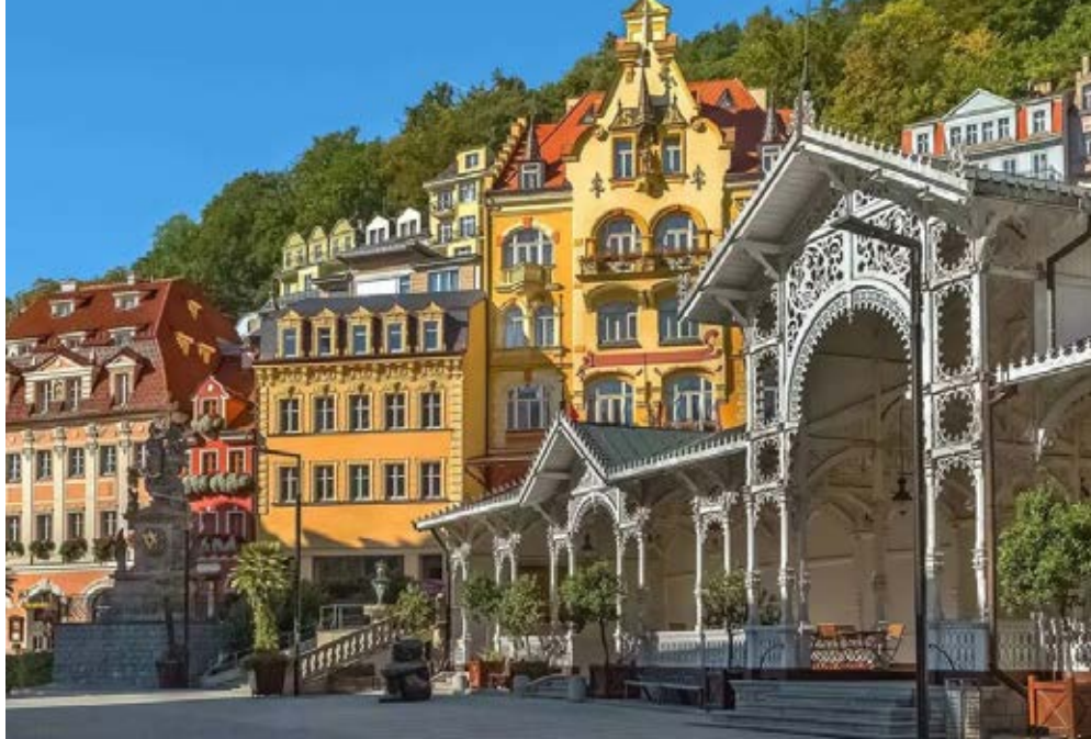
Ostrov | Böhmen | Paket 5768