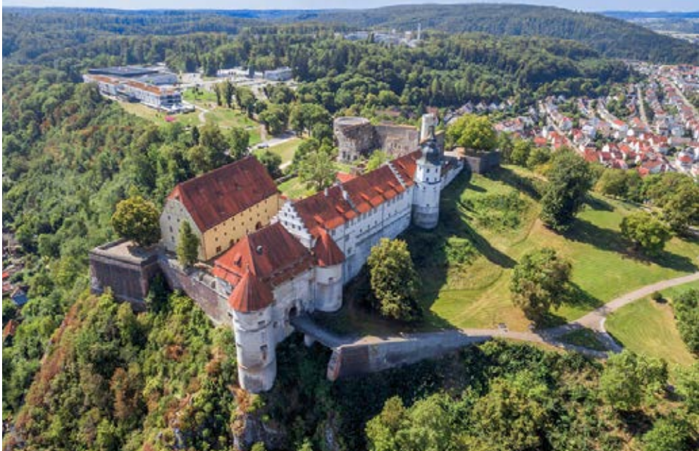
Heidenheim | Schwäbische Alb | Paket 4295