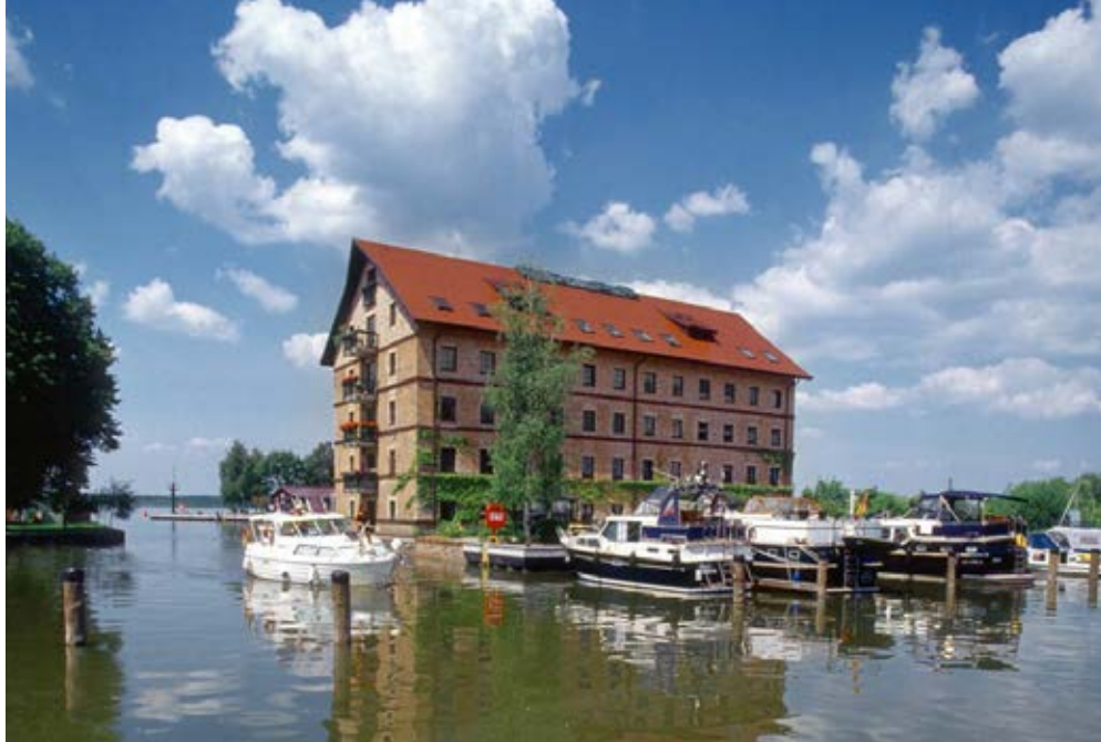
Neustrelitz | Mecklenburgische Seenplatte | Paket 1075