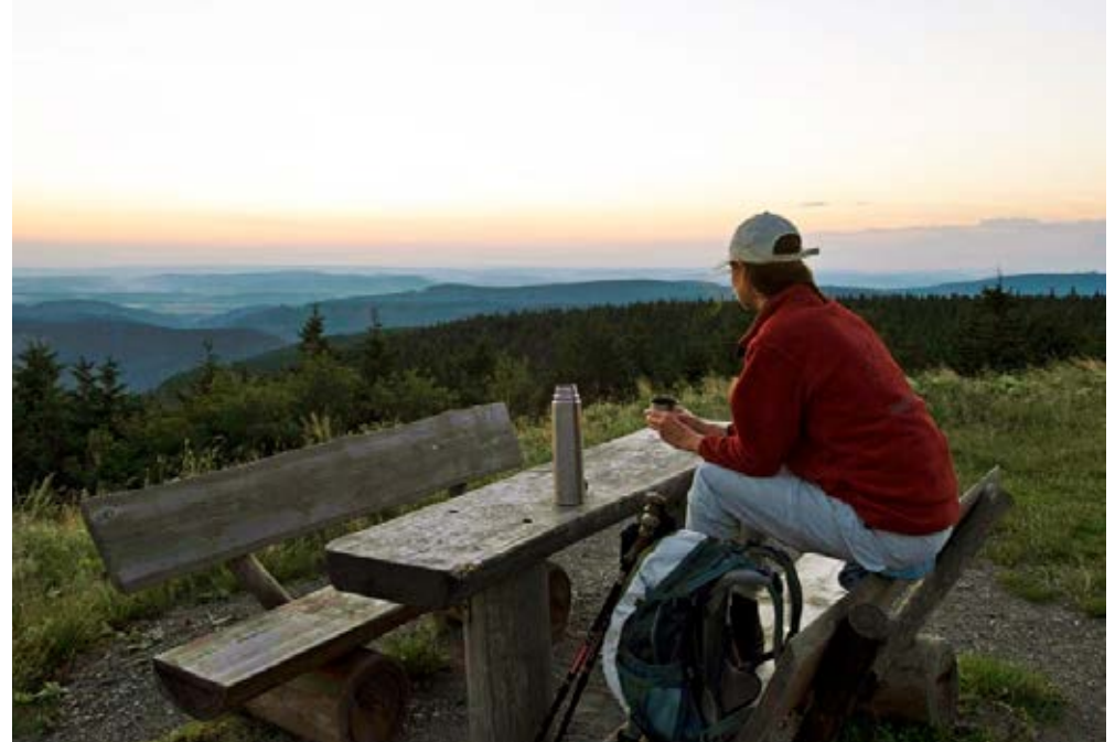
Oberhof | Thüringer Wald | Paket 3470

Verl.-Nacht/F 66,- | EZ 34,- | Hauptsaison 10,- | Vor Sa./So./Fei. 7,-